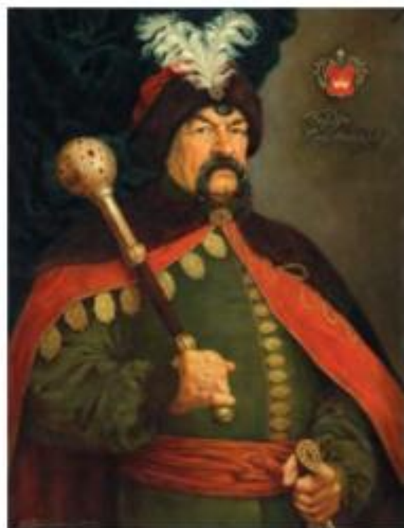
▲ Наталія Павлусенко. Богдан Хмельницький (2016)

Богдан Хмельницький (1595–1657) – один із найславніших козацьких гетьманів. Недарма українці говорили: «Від Богдана до Івана не було гетьмана», тобто від часу Богдана Хмельницького до Івана Мазепи ніхто не міг дорівнятися розумом, славою і звитягою до цих великих українських державників. У непросту історичну добу Б. Хмельницький проявив себе чудовим стратегом і тактиком. Готуючи збройне повстання проти Речі Посполитої, він повсюди розіслав гетьманські універсали, які закликали українців вступати до козацького війська, налагодив виробництво пороху, закупівлю зброї, гармат, харчів, фуражу для коней. За підтримки Османської Порти уклав союзницьку угоду з кримським ханом. Закономірно, що український народ створив багато пісень і легенд про Б. Хмельницького. Союз із Московією Б. Хмельницький сприймав як звичайну воєнну угоду – домовленість про спільні дії і підтримку на міжнародній арені. Проте ця угода обернулася страшною пасткою для України, втратою державності й більш ніж трьохсотлітньою неволею. Про Б. Хмельницького знято чимало фільмів, написано симфонічні поеми й опери, видано чимало біографічних книжок. Найвідомішими є роман-дилогія Павла Загребельного «Я, Богдан» та історичний роман у віршах Ліни Костенко «Берестечко».